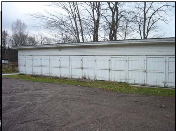
Grebo kyrka 1937 och kyrkstallarna 2007