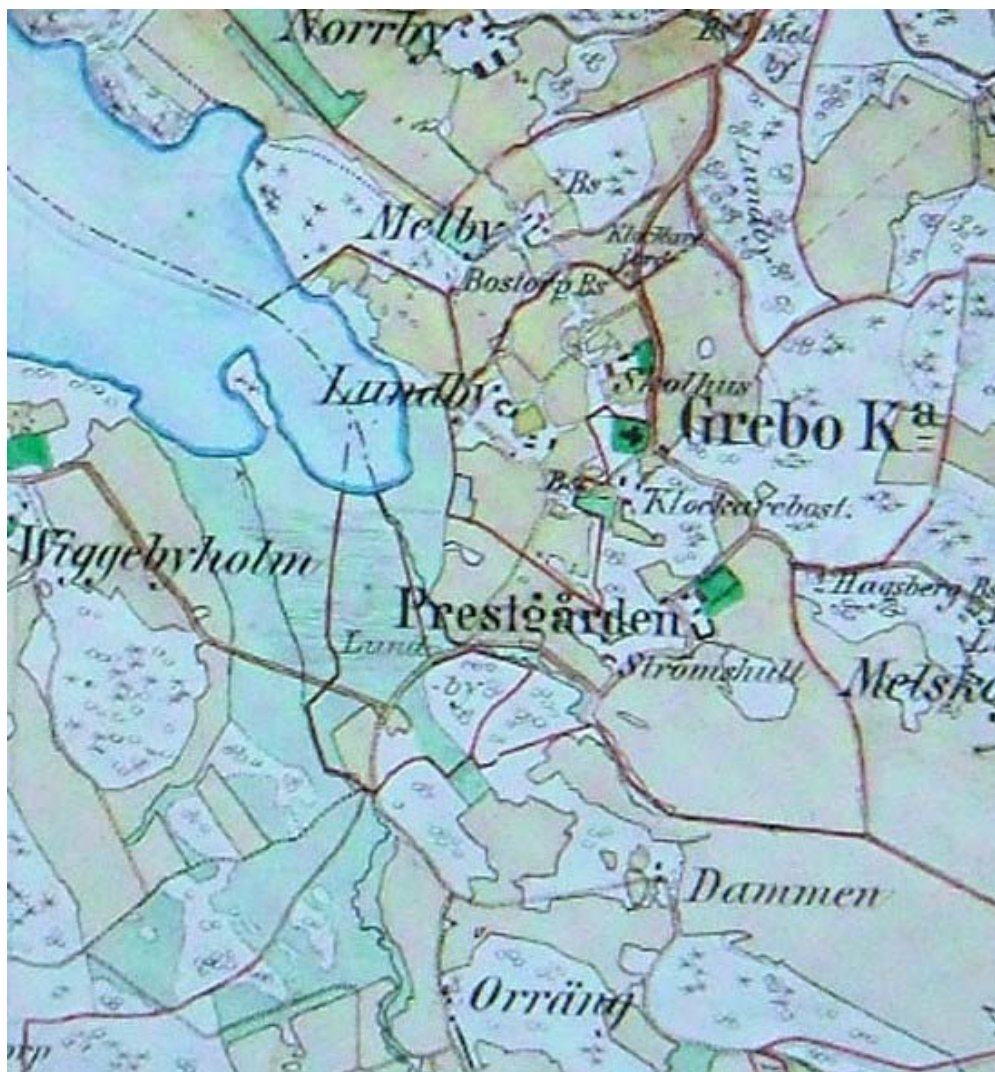
Utsnitt ur Häradsekonomisk karta 1868-1877, Sturefors