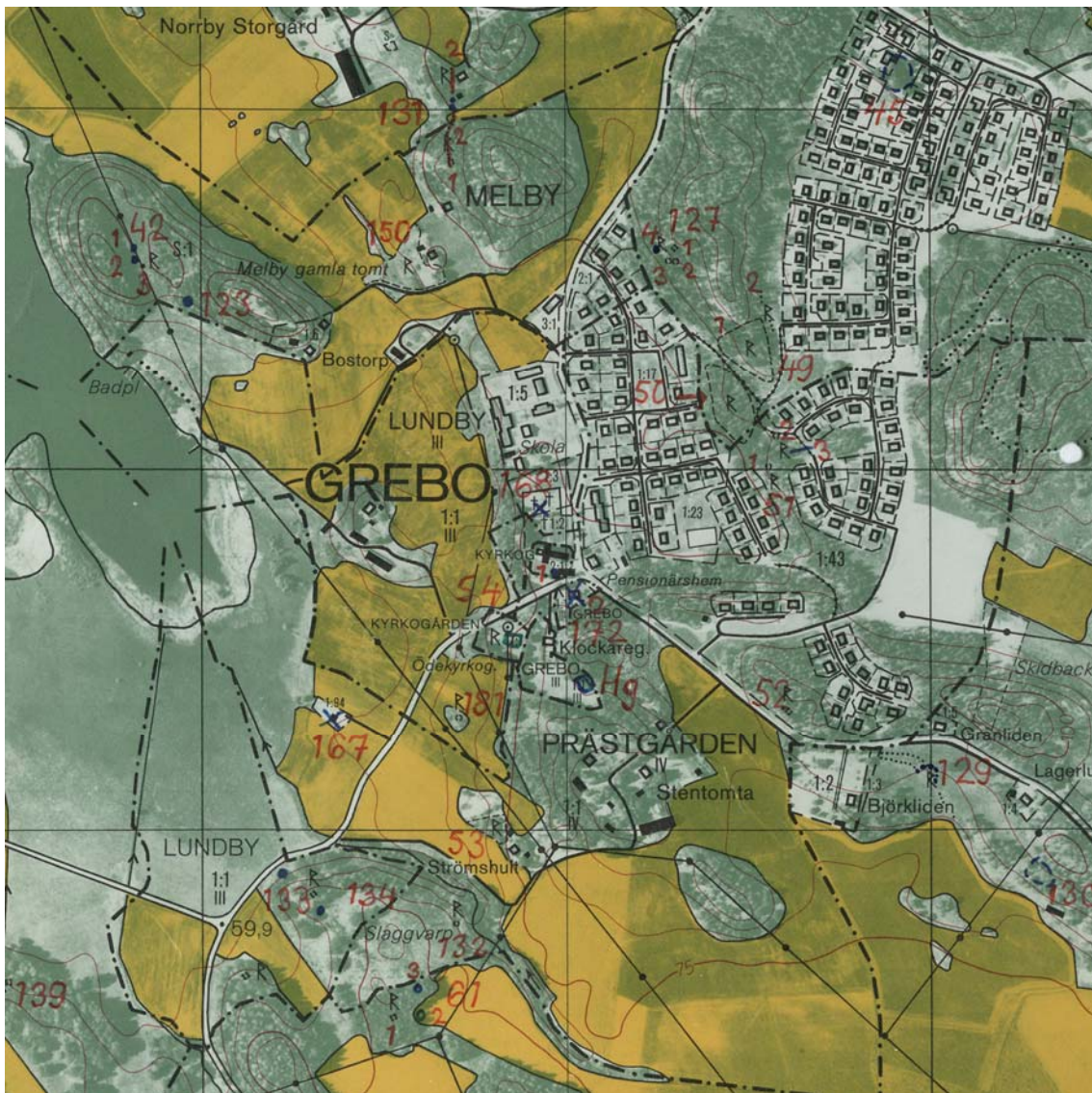
Utsnitt ur Ekonomisk karta blad 8G 2a Grebo