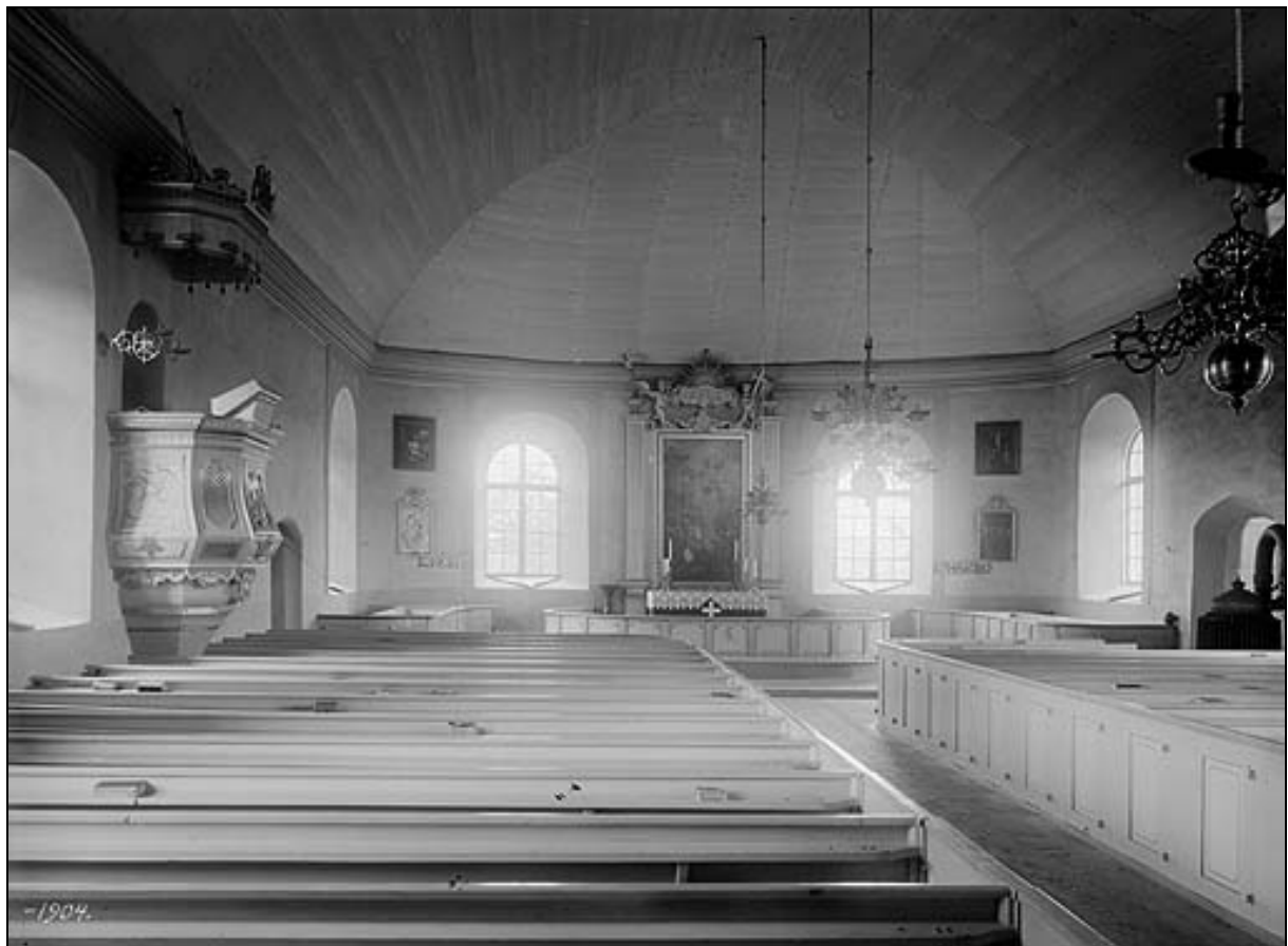
Hycklinge kyrka 1904.

det bevarade tornet. Kyrkan uppfördes 1792 av sten med rektangulärt långhus med tresidigt avslutat kor i öster och sakristia mitt på nordsidan.