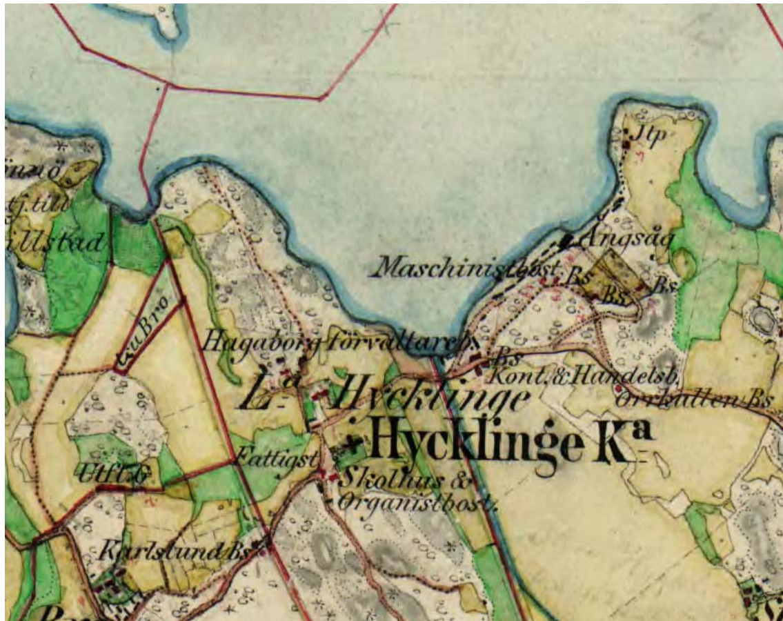
Hycklinge på häradskartan 1868-1877, blad Hycklinge.