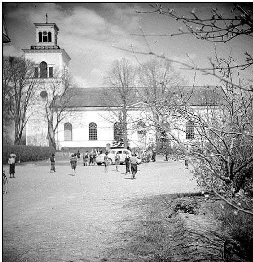
Mogata kyrka år 1945.

Mogata kyrka ligger en mil sydöst om Söderköping i tätorten Mogata som under 1900-talet vuxit från kyrkby till ett villasamhälle. Kyrkan är belägen i ett vägshål och på dess södra sida finns Mogata gamla tingsplats, idag i form av en öppen kyrkplan omgiven av byggnader som haft en administrativ funktion. Tingshuset som tillkom kring 1700, är en av länets äldsta bevarade tingshusbyggnader. Det är en timrad gulreveterad byggnad under högt och brant valmat tegeltak. Det såldes 1904 till socknen som ålderdomshem men fungerar idag som församlingshem. Här finns också den fd sockenstugan jämte arrestlokal, en timrad rödpanelad tvåvåningsbyggnad under tegeltak. Den fd skolan från 1859 är en reveterad byggnad med spritputsade fasader och frontespis under brutet tegeltäckt tak. Lärarbostaden från 1860, idag pastorsexpedition, är en vitreveterad byggnad med spritputsfasader och frontespis under tegeltäckt sadeltak. Öster om kyrkan finns ett skolområde med moderna skollokaler. Den gamla prästgården ligger i närheten av Slätbaken, ca 1 km från samhället.