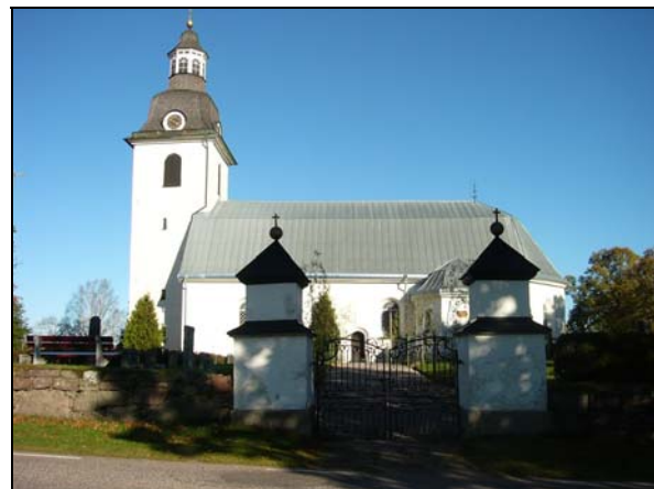
Norra Vi kyrka ca år 1900 och 2007.

Interiören är mycket välbevarad och altaruppsats, bänkinredning och läktare med bevarade bänkar hör till den ursprungliga inredningen från 1774. De slutna bänkkvarteren är uppdelade i tolv kvarter, möjligen med kvarvarande mans- respektive kvinnogångar. Sannolikt har de yttre bänkkvarteren tillhört den äldre kyrkan. Under 1790-talet försågs kyrkorummet med ny altaruppsats, predikstol och orgel. Den senare är tillverkad av orgelbyggaren Pehr Schiörlin i Linköping. Från den medeltida kyrkan härrör bl. a en dopfont och lokalt tillverkad predikstol och altaruppsats, samtliga från 1600-talet. Sakristian präglas av kyrkoherde Lars Kraft Larsson, som var den drivande kraften bakom kyrkobygget. Under sakristian finns hans grav och på östväggen ett stort epitafium.