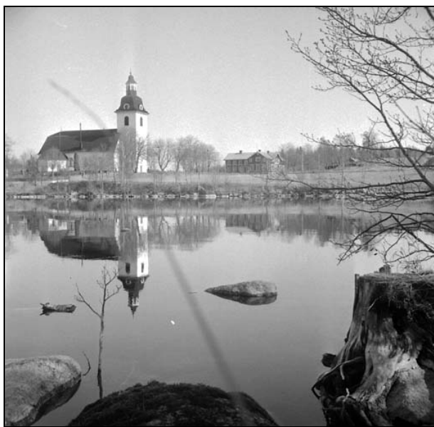
Norra Vi kyrka 1947.

Kyrkan är belägen ca 15 km sydväst om Kisa vid en vik i södra delen av sjön Sommen. I nordost finns kyrkstillarna, som delvis är ombyggda till vattenverk. Invid kyrkan, men på andra sidan landsvägen, ligger den mycket välbevarade f d skolan, som numer används som bl a församlingshem. Den utgörs av en stor tvåvåningsbyggnad med rödfärgade fasader, uppförd 1871 och ombyggd 1910. Väster därom, vid Norrhamra, är f d ålderdomshem och f d prästgård belägna. Ålderdomshemmet är uppfört 1865 och utgörs av en tvåvåningsbyggnad med rödfärgade fasader under tegeltäckt sadeltak. Prästgårdens mangårdsbyggnad, som är uppförd 1860, är högt belägen i en stor trädgård. Strax nordost om kyrkan ligger säteriet Ribbingshov med en stor huvudbyggnad i två hela våningar flankerad av två flyglar. Huvudbyggnadens bottenvåning härstammar från 1690-talet, men på- och ombyggdes 1806.