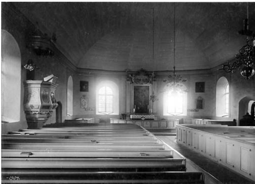
Oppeby kyrka 1904.