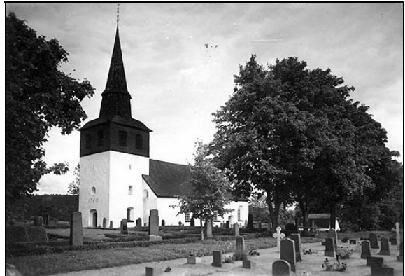
Oppeby kyrka på 1940-talet.