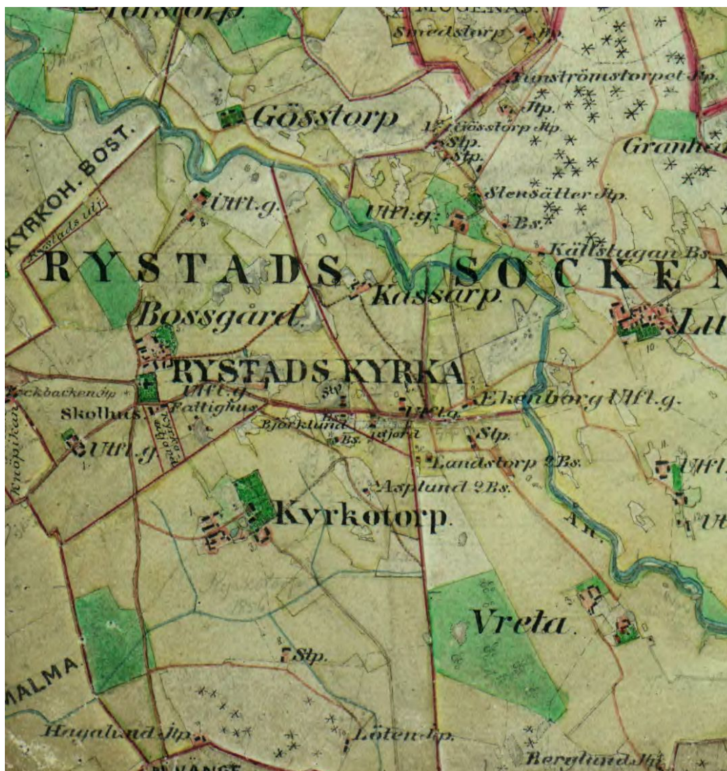
Rystad på häradskartan från 1870-talet.