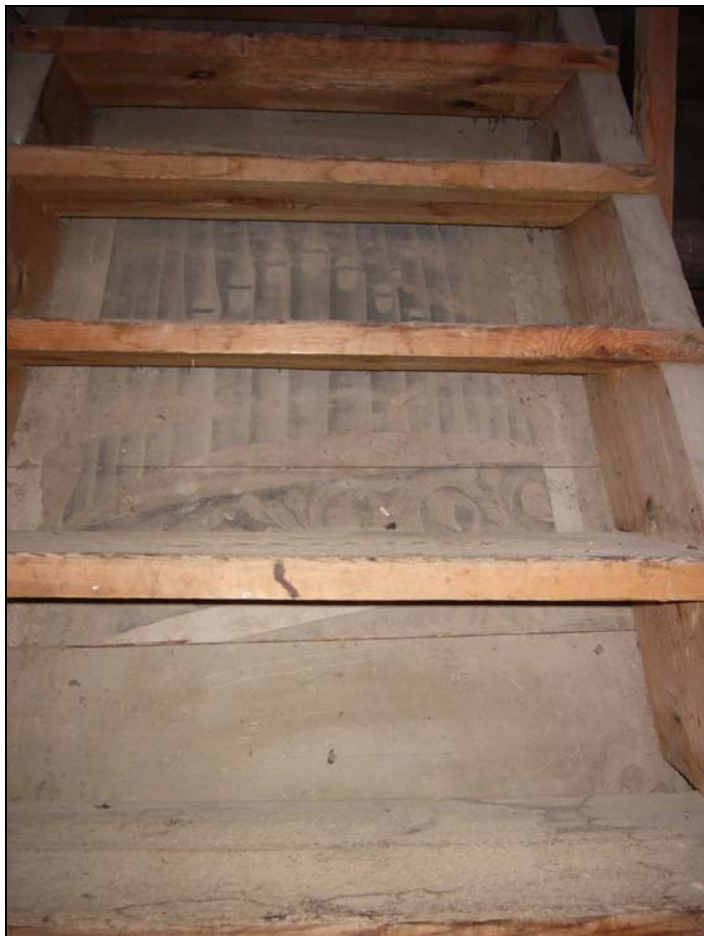
Nyupptäckta sekundärt placerade målningar i torntrappan.