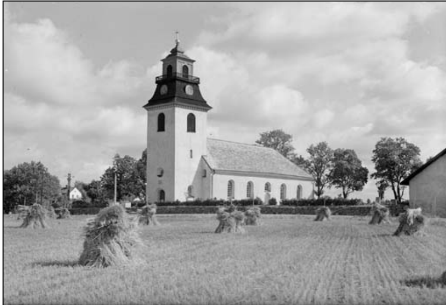
Rystad kyrka 1956.

Kyrkan är belägen ca 8 km nordost om Linköping på en svag höjd med utblickar över det fornlämningsrika odlingslandskapet. Ett nytt skolhus, som även inrymde bostad för skolläraren uppfördes 1891 och utgörs av en reveterad byggnad i 1½ våning under sadeltak. Skolan nedlades 2003. Parallellt med skolbyggnaden uppfördes 1909 ett ålderdomshem med liknande fasadutformning. Byggnaden används idag som församlingshem. En lärarbostad, nu i privat ägo, uppfördes 1930 med reveterade fasader under ett högt brutet sadeltak. Den innehöll även bostad för kantorn. I skolmiljön finns även det f d kommunalhuset, vilket utgörs av en mycket enkel rödfärgad byggnad under brutet tak. Förutom kommunalrum innehöll byggnaden slöjdsal. Ute på slätten, ca 500 meter från kyrkan, är den f d prästgården belägen.