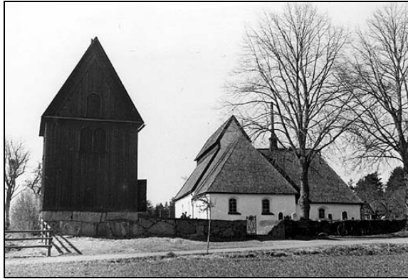
Värna kyrka 1939