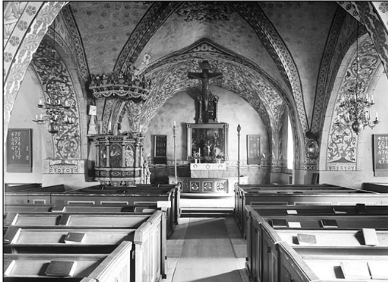
Torpa kyrka 1899