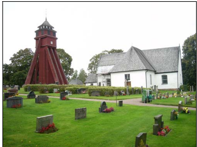
Torpa kyrka 1938 och 2007